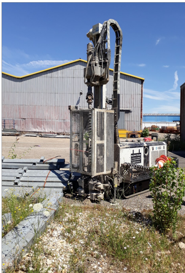
Forage parc à cuves

Missions INFOS et DIAG selon la norme NF X 31-620