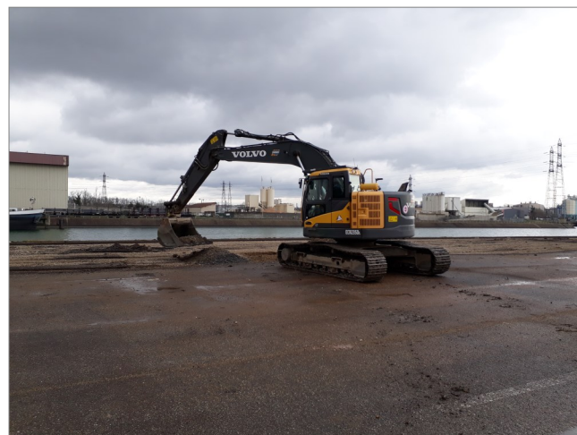
Fouilles à la pelle