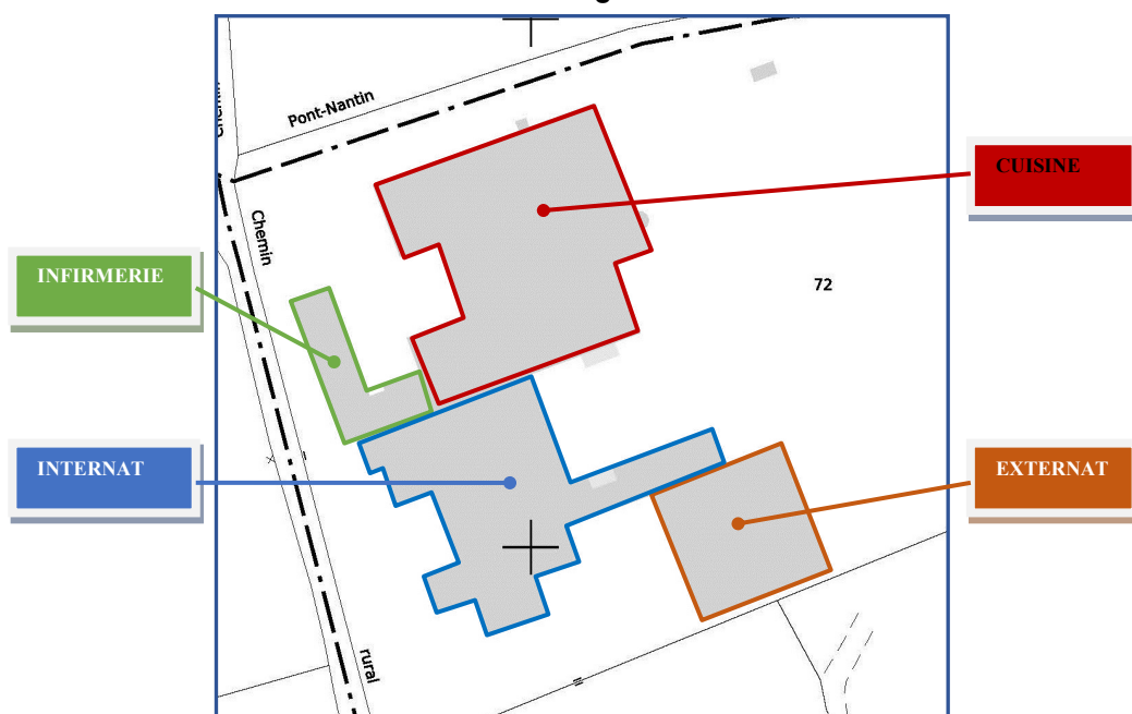
Répartition des bâtiments de la zone de projet