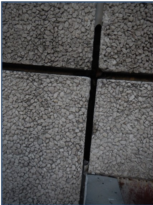
Joints entre éléments préfabriqués