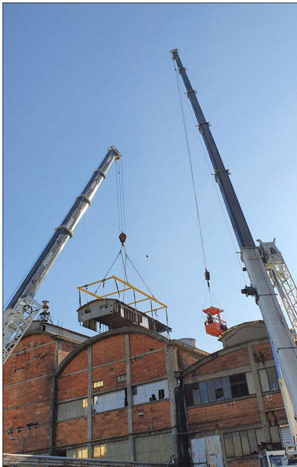
Dépose d'éléments de superstructures fragilisés

Maîtrise d'œuvre de démantèlement et déconstruction des bâtiments et installations