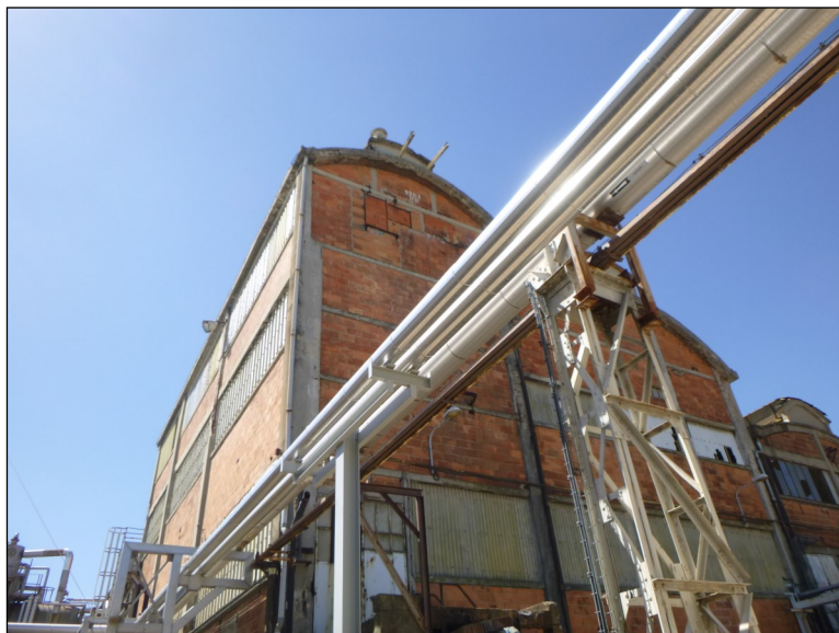
Vue générale de la chaufferie

Montant des travaux : 950 000, 00 € HT (Estimation)