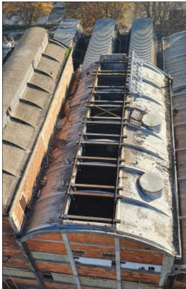
Vue des couvertures après opérations de mise en sécurité préalables